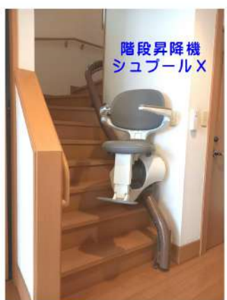
階段昇降機 シユプールX

座った状態のまま階段を昇り降りできる『階段昇降機』のご提案をさせて頂きました。階段が広く造られていたため、昇降機を階段の外側に設置するか、外側だと国産の商品「タスカール」が設置できるため、今付いている手すりを外さないといけない。レールが外回りで設置されるため、距離が長く、掃除がしにくくなってしまう。1階の廊下にレールが40センチほど伸びてしまうため、玄関へのアプローチがしにくい状況がある事をお伝えしました。内側だと海外製の商品「シユプールX」で、1階廊下のレールも伸ばさずに設置する事ができ、レールも国産に比べるとシンプルで、それ程目立たない仕様になります。また、1階2階とも昇降機から降りる際に、椅子の位置を調整できるため、車椅子への移動動作を楽に行う事ができ、介助負担の軽減に繋がる事をご提案しました。(但し、国産に比べると費用負担は高い。) 結果、今回は使い勝手が良く、内側に設置する『シユプールX』をご選択頂きました。ご家族様からも、椅子の位置が調整できるので、介助が楽になり助かっています。嬉しいお言葉を頂戴しています。