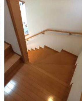
階段はコの字型で 傾斜もやや急である