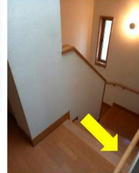
階段外側には既に 手すりが設置されている