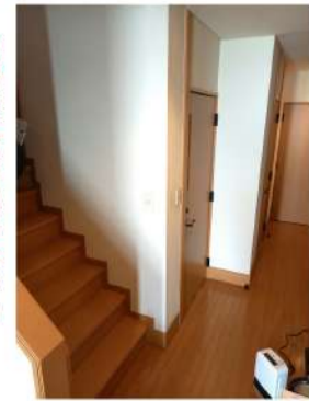
階段は玄関前にある

2階にリビング、寝室がある生活を送っていたが、足腰が弱くなり、家族の介助のもと、昇降動作を行っていた。1階だと日当たりが良くないため、何とか2階で生活を続けていきたいと思っていた。どうしたら2階で生活を続けていけるか相談したい。