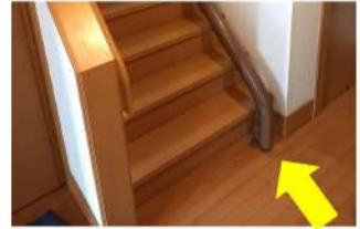
玄関からの往来も支障なく、廊下へのレールの飛び出しを最低限にしました