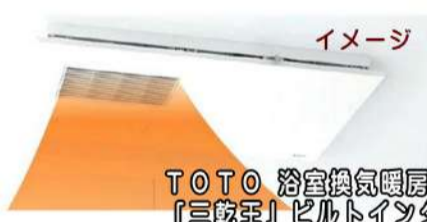
イメージ TOTO 浴室換気暖房乾燥機「三乾王」ビルトインタイプ

ヒートショックの対策として最も効果的なのが、上記①の「温度差を無くす」です。脱衣所と浴室をあらかじめ暖めておく方法としては、事前に湯舟のフタを開けておく、事前に暖かいシャワーを出せばなしにしておく、などがありますが、前者はお湯が冷めやすくなるし、後者は水道代がムダになります。そこでおすすめなのが、 浴室暖房機 です。その名の通り、浴室や脱衣所を温めておけるので、温度差が圧倒的に少なくなります。