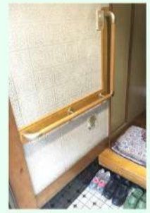
一般的な手すり設置例