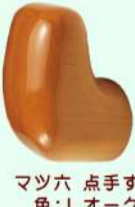
マツ六 点手すり 色：Lオーク