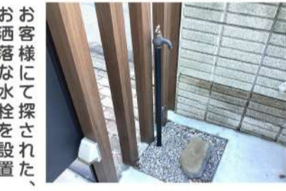
お客様にて探された、お洒落な水栓を設置