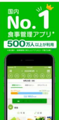
A | 食事管理アプリ「あすけん」