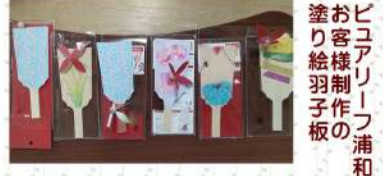
ピュアリーフ浦和 お客様制作の塗り絵羽子板