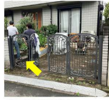
施工前玄関の様子。門扉横にも階段があるので介護車両を使用しているため車両間口にも余裕が欲しい。

玄関前に階段があり、設置式スロープを使用しているため、車いすでの移動が困難となっている。門扉までのアプローチは敷石で、車いすでの移動が困難となっている。