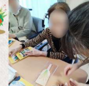
完成した羽子板は次ページで紹介!