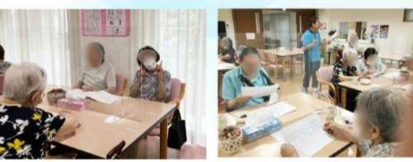
懐かしの昭和歌謡を合唱!