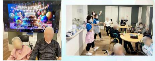
お誕生日会と体操レク