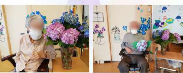
職員持参の紫陽花と記念写真