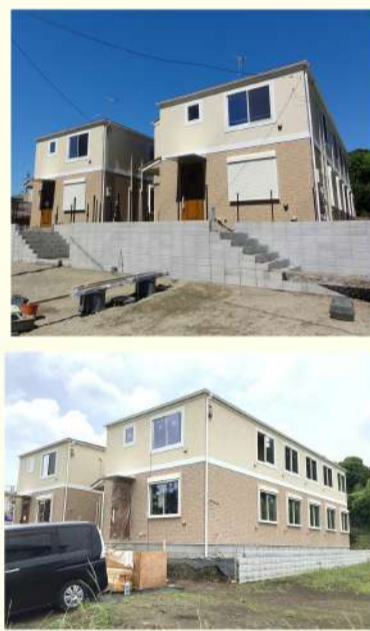
写真は建設中のものです