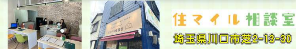
住マイル相談室 埼玉県川口市芝2-13-30