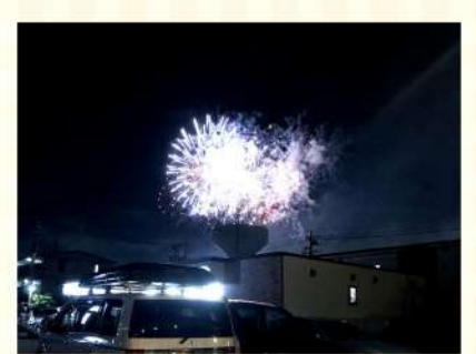
当施設駐車場から見た、8月28日開催のたたら祭りの花火