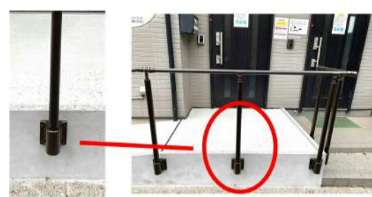
スロープ側面から手すりを設置することによりスロープ幅を広くとることができました。