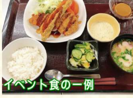
イベント食の一例

ピュアホームズグループならではの特典として、旅行事業部（PIT）の企画する特典旅行に無料でご招待（※）。他にも、弊社住マイル相談室による住み替え相談や、ケアマネジャーによる健康相談、福祉用具レンタル・販売など、様々な事業を手掛ける弊社ならではのチームケアで、お客様の日々の暮らしを更に充実させるお手伝いをさせて頂きます。