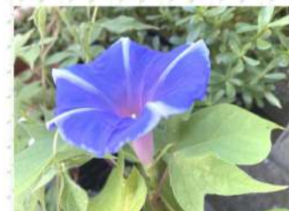
7月に種まきした朝顔が咲きました(彩の郷)