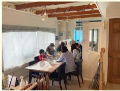
川口市前上町セルコホテルハウス 販売中!