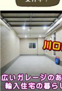
広いガレージのある輸入住宅の暮らし

お問い合わせはお気軽に... セルコホーム 株式会社ピュアホームズ TEL: 048-(267) 2273