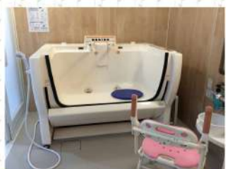
ぴゅあテイリゾートOHANA 機械浴槽