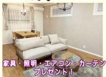
家具・照明・エアコン・カーテン プレゼント!