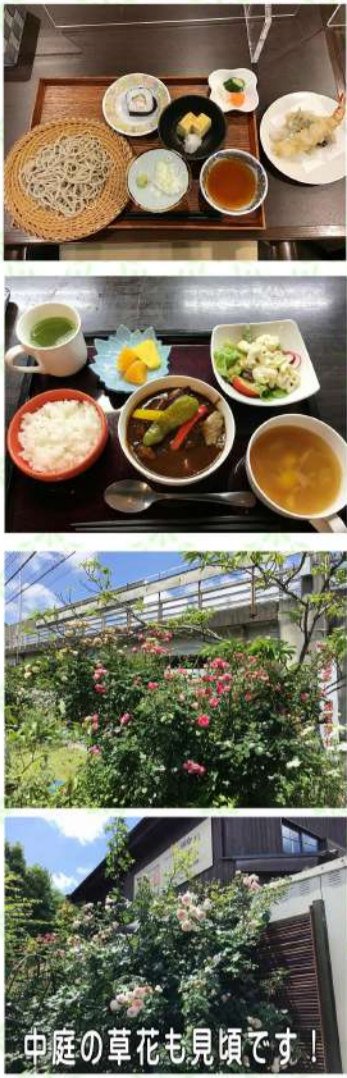
中庭の草花も見頃です！

毎月大好評を頂いておりますイベント夕食ですが、4月末は神楽本店よりそばと天ぷらのセット。5月にはリストランテ谷澤特製ビーフシチューをご提供させて頂きました。