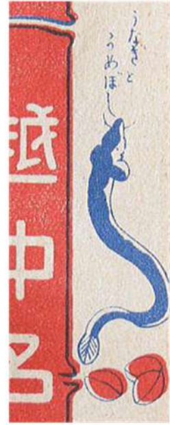
大正時代のイラストよく見ると銀杏ほい?