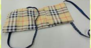
④左側も同じように折り、ゴムをかけます