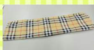
②ハンカチを広げて4つ折りにします