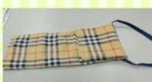
③右側3分の1を折り、ゴムをかけます