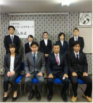
入社式後の記念撮影

出来ることを最大限に活かし活躍できるよう努めます！ ティサービス配属予定 趣味:お菓子作り