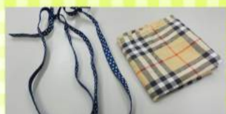
①用意するもの ハンカチ1枚・ヘアゴムまたは輪にしたゴムひも2本